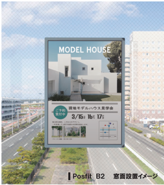
Posfit B2 窓面設置イメージ