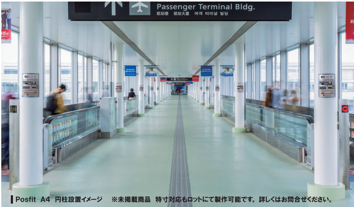
Posfit A4 円柱設置イメージ ※未掲載商品 特寸対応もロットにて製作可能です。詳しくはお問合せください。