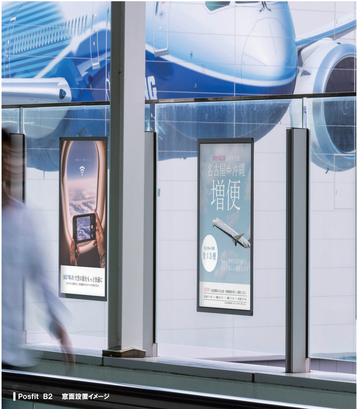
Posfit B2 窓面設置イメージ