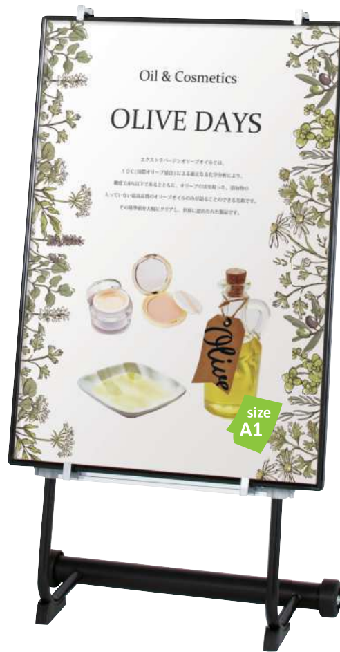
フリーパネルR型(A1)との組合せ例