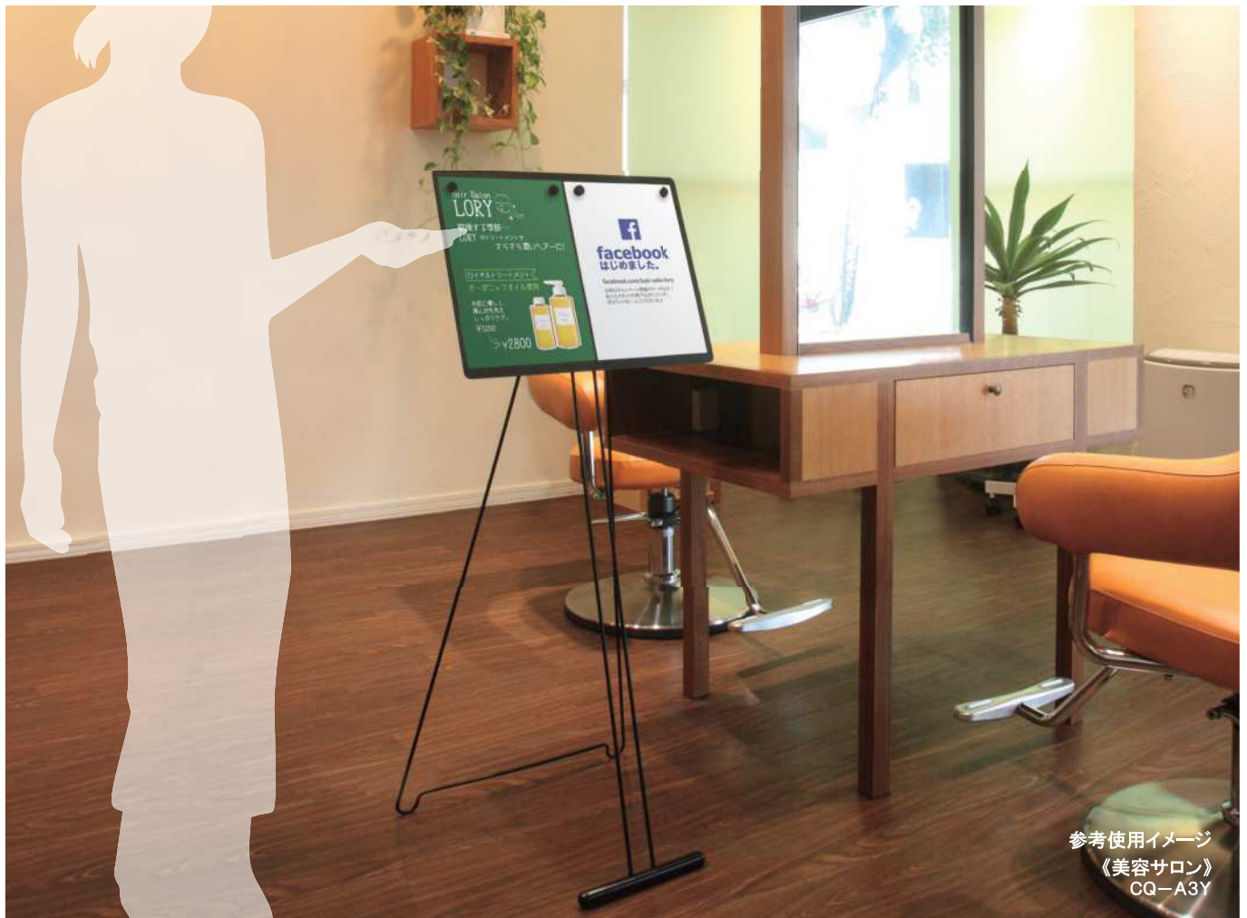
参考使用イメージ 《美容サロン》 CQ-A3Y