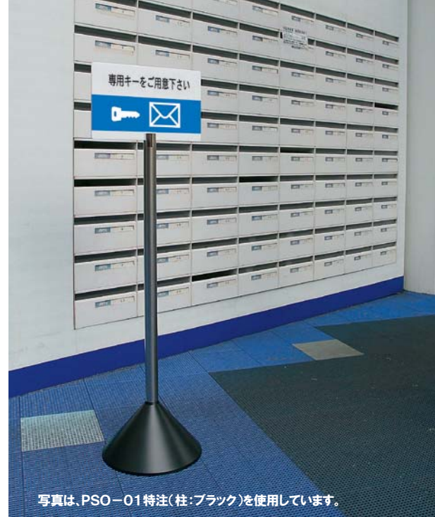
写真は、PSO-01特注(柱:ブラック)を使用しています。