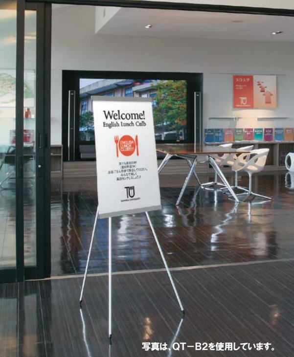
写真は、QT-B2を使用しています。