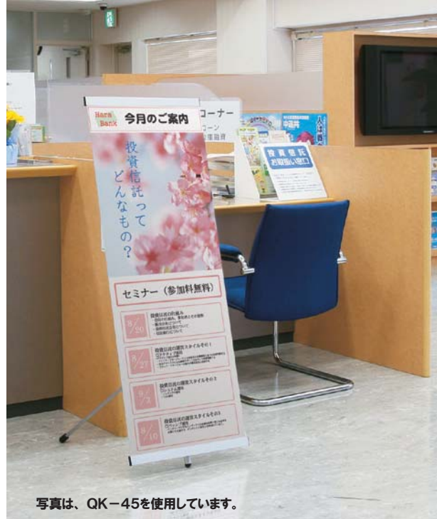
写真は、QK-45を使用しています。