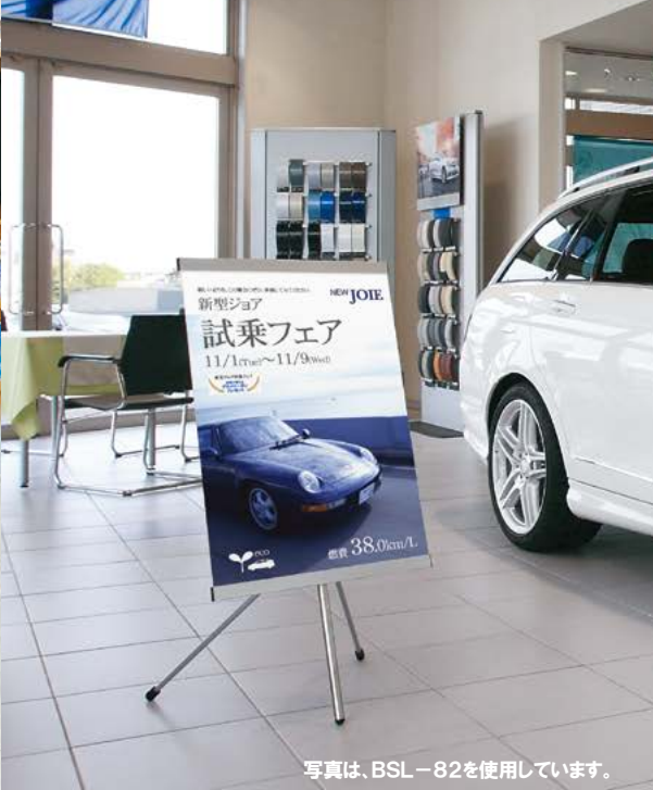
写真は、BSL-82を使用しています。