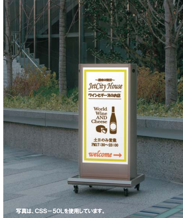
写真は、CSS-50Lを使用しています。