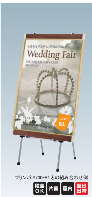
プリンバ S730-B1 との組み合わせ例