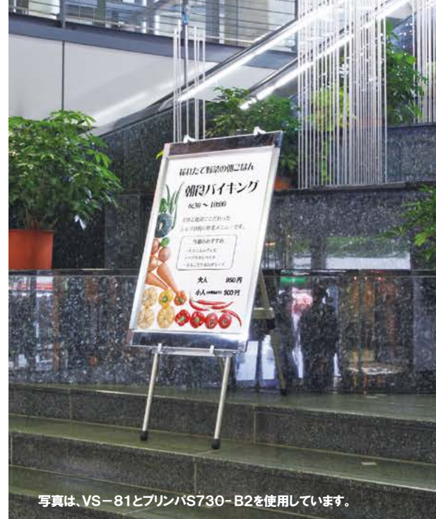
写真は、VS-81とプリンバS730-B2を使用しています。