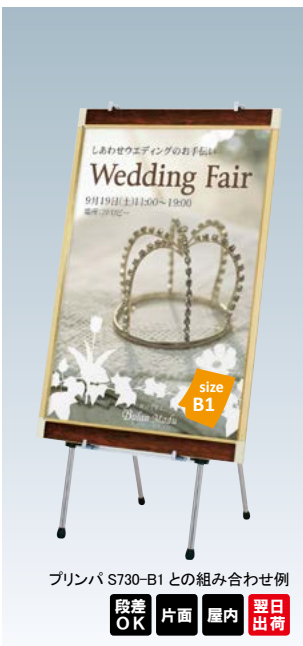
プリンバ S730-B1 との組み合わせ例