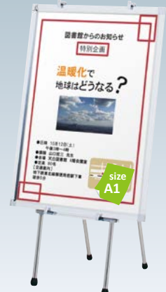
プリンバ S30-A1 との組み合わせ例