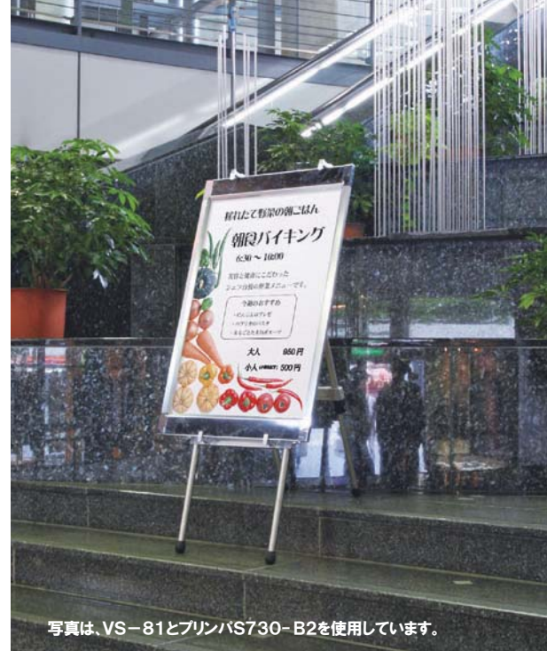
写真は、VS-81とプリンバS730-B2を使用しています。