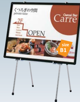
プリンバ R30-B1 との組み合わせ例