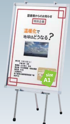
プリンバ S30-A1 との組み合わせ例