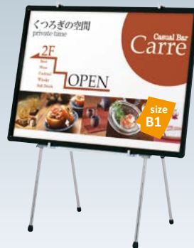
プリンバ R30-B1 との組み合わせ例