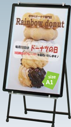
プリンバ R30-A1 との組み合わせ例

重量 ■ 3.5kg 本体 ■ スチール黒塗装仕上 上部柱 ■ アルミ押型材アルマイト仕上 パネルサイズ ■ 厚み 30mm まで 幅 550 ~ 900mm まで対応 ※パネルは含まれておりません。