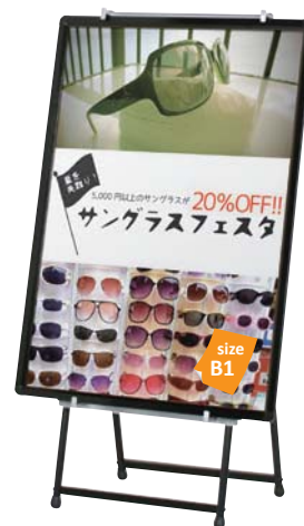
プリンバ R30-B1 との組み合わせ例