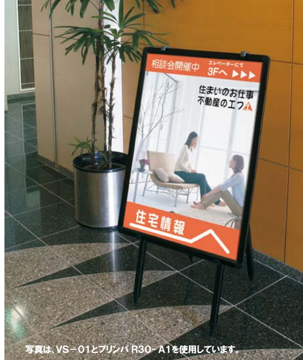
写真は、VS-01とプリンバ R30-A1を使用しています。