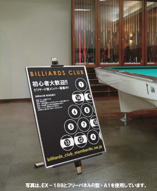
写真は、EX-188とフリーパネルR型-A1を使用しています。