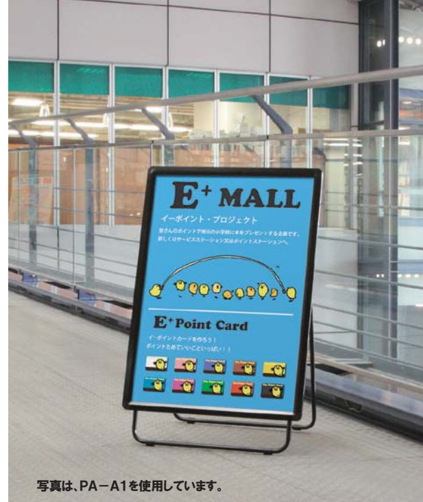
写真は、PA-A1を使用しています。