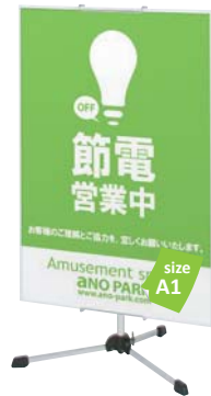
スリムエイト -A1 との組み合わせ例