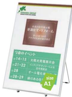
スリムエイト -A1 との組み合わせ例