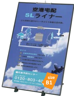
フリーパネル R 型 -B1 との組み合わせ例