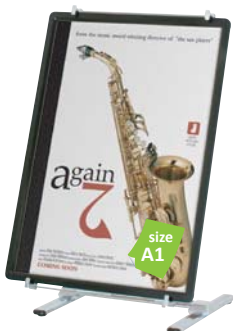
プリンパ R30-A1 との組み合わせ例