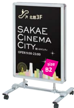
両面パネル (R30-B2) 付き