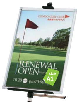
プリンパ S30-A1 との組み合わせ例