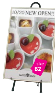
ツートンパネル -B2 との組み合わせ例