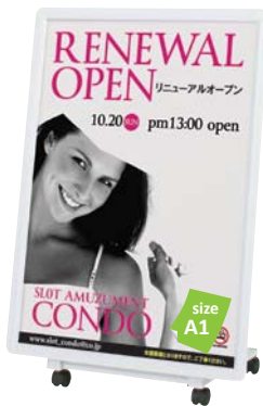
片面パネル (屋外用 R30-A1) 付き