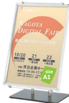
プリンパ S30-A1 との組み合わせ例