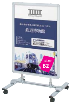
片面パネル (R30-B2) 付き