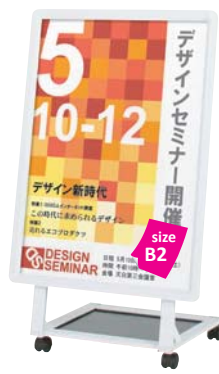
片面パネル (屋外用 R30-B2) 付き