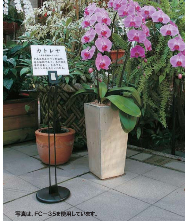
写真は、FC-35を使用しています。