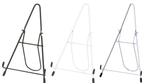
カウンターイーゼル大(ブラック/ホワイト/クローム)