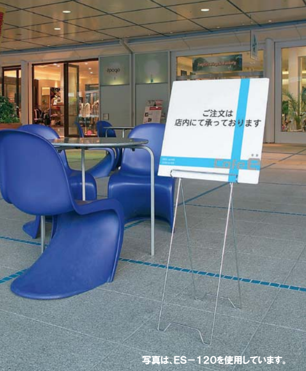
写真は、ES-120を使用しています。