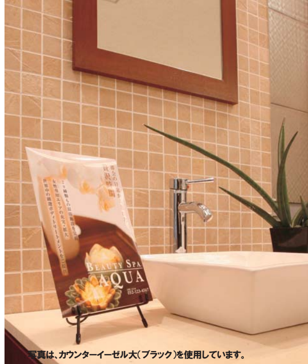
写真は、カウンターイーゼル大(ブラック)を使用しています。