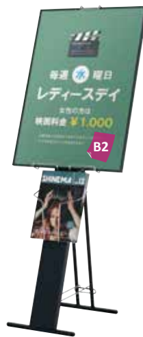
オストレッチ-B2との組み合わせ例

本体 ■ スチール黒塗装仕上 ラック ■ スチールクロームメッキ仕上 A4&B4 (可変式ワイヤーラック) カタログ厚み ■ 25mm まで パネルサイズ ■ B2 ~ B1 まで 厚み 25mm まで対応 ※パネルは含まれておりません。